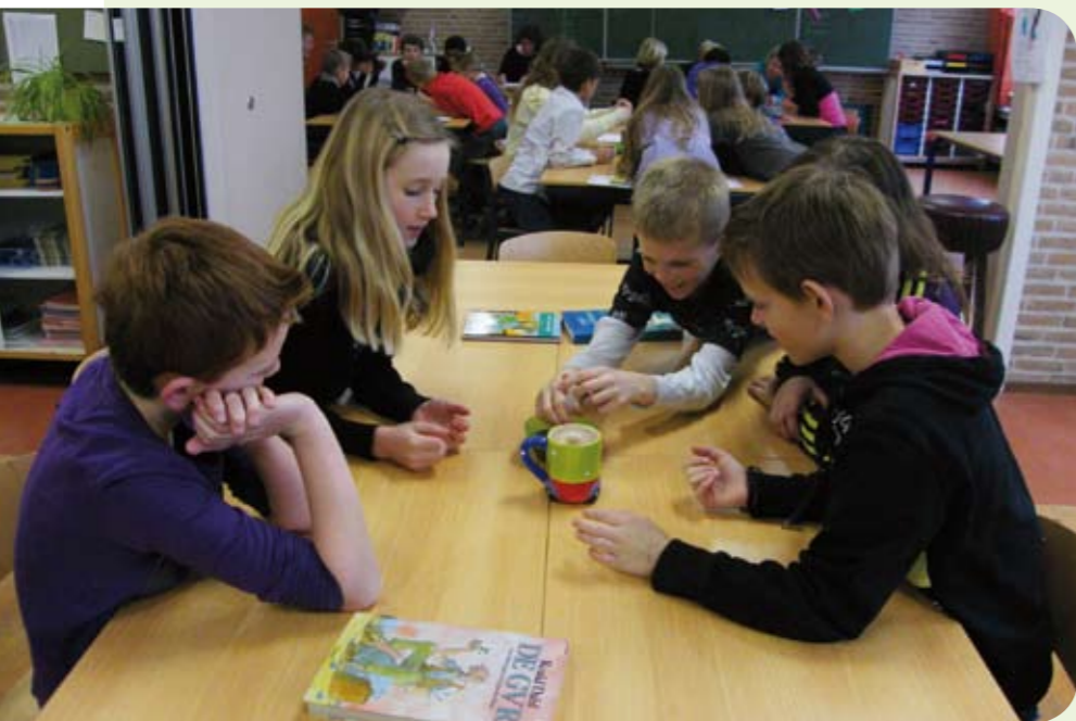
Leerlingen van 'De Meerpaal' doen onderzoek met bakjes water, zand en een injectie-spuut. De verwerking werd er in 2-tallen gedaan. Ze gingen keihard aan het werk met een samenvatting.

Voor meer informatie over Brein Fijn Leren, kunt u contact opnemen met Piet Beemsterboer en Kitty Broers: T (0229) 25 93 80 E pbeemsterboer@obdnoordwest.nl E kbroers@obdnoordwest.nl